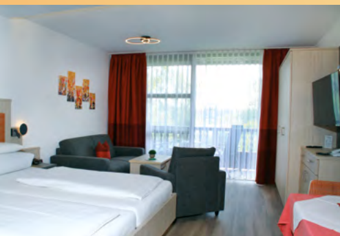
Typ 1 - Der Klassiker

Mit den hochwertigen Vorhängen lässt sich das Appartement komplett verdunkeln, so dass Sie ungestört schlafen können. Der 40" große Flachbildschirm-TV bietet Ihnen hervorragendes Fernsehvergnügen. In den Zweizimmerappartements ist jeweils ein Fernseher im Wohnzimmer und einer im Schlafzimmer. In der separaten Küchenzeile stehen Ihnen Kühlschrank, zwei Herdplatten und Kaffeemaschine sowie ausreichend Koch- und Essgeschirr zur Verfügung. Einen Toaster oder Wasserkocher stellen wir Ihnen auf Wunsch gerne bereit.