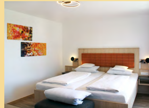
Typ 4 - Das Elegante

In einigen Appartements haben wir geräumige Duschen für extra Komfort. Der pflegeleichte, angenehme Vinylboden sorgt für ein gutes Raumklima. Die hellen Schreinermöbel und neue Polstermöbel sowie eine zeitgemäße Beleuchtung und freundliche, farbige Accessoires runden das moderne Wohlfühlambiente ab.