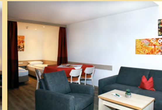
Typ 5 - Das Komfortable